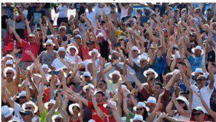
Masters de pétanque 2019 à Montluçon.