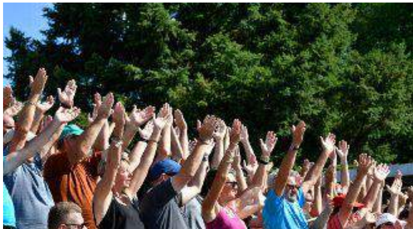
Masters de pétanque 2019 à Montluçon.