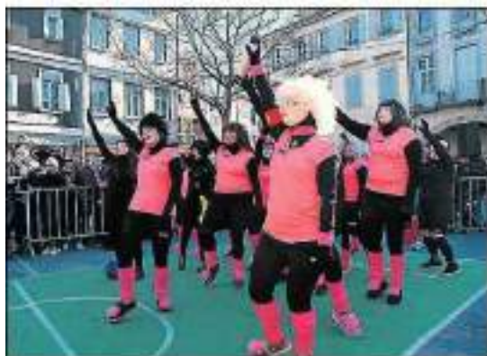
Les Poupinetos se sont dépêchées sans compter sur la place, et ont démonstrativement fêté leur victoire.