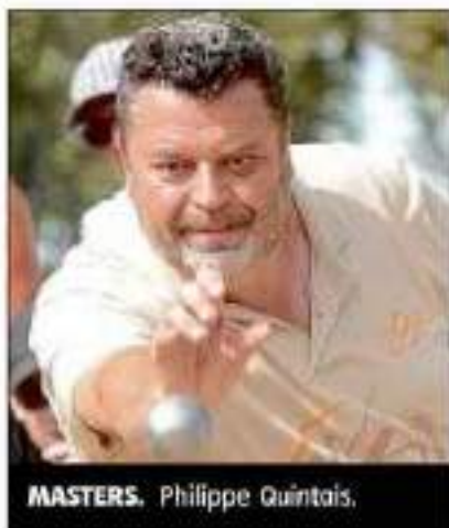
MASTERS. Philippe Quintais.