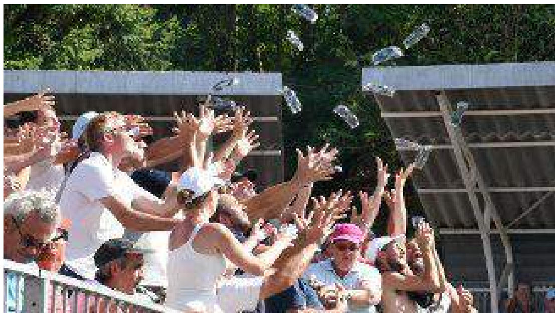
Masters de pétanque 2019 à Montluçon.