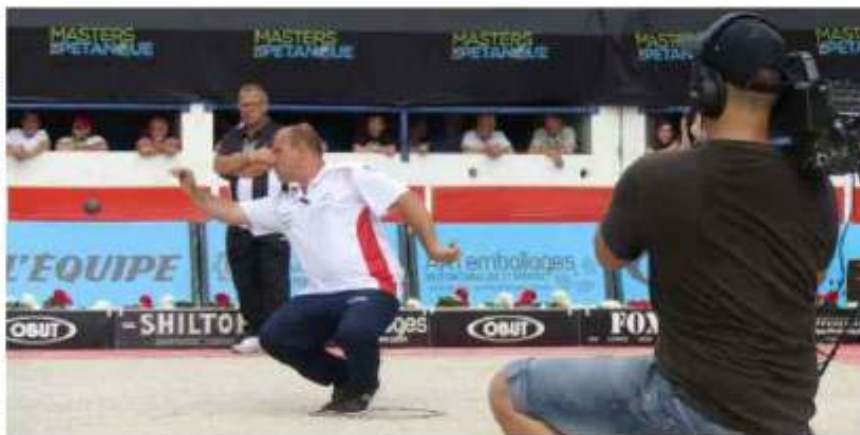
Les Masters de pétanque traversent la France. Les 19 et 20 juin, la compétition est passée par Châteaurenard.

La journée du mercredi 31 juillet est dédiée aux locaux. En effet, trois moments forts marqueront cette première partie de la 6 e étape des Masters de pétanque 2019. À 9 h 15, les plus jeunes seront mis à l'honneur avec une compétition pour les 8-15 ans qu'ils soient licenciés ou non de la Fédération française de pétanque et jeu provençal. Un moment que les concurrents pourront partager avec Dylan Rocher, champion du monde. Puis à 10 heures, rendez-vous avec la sélection de l'équipe locale. Des matchs qui permettront de choisir les trois Clusiens qui auront le chance de jouer les Masters contre les champions présents. À noter qu'à 18 h 30, un tournoi convivial opposera des locaux, parterriens et champions. Enfin à 20 heures, l'en-