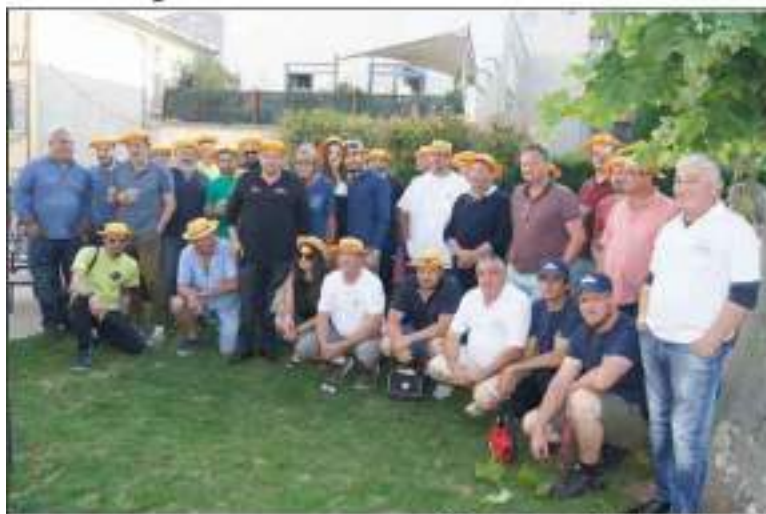
20 entreprises participent aux After works.

Jeucl 7 juin, place Jules Nadi, la première rencontre des After-Works a réuni 20 entreprises. Les concours se déroulent en triplettes. Une nouvelle fois la