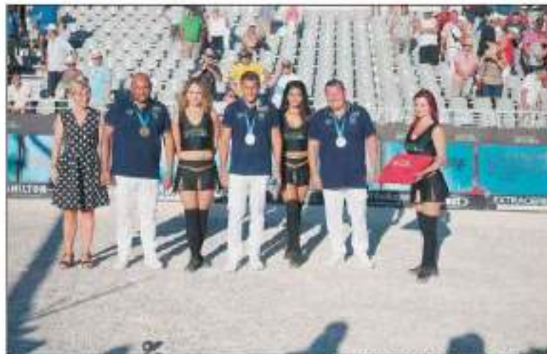
Les meilleurs mondiaux seront présents...

Le 18 juillet 2019, les Masters de Pétanque feront de nouveau halte à Romans. Les meilleurs mondiaux s'affrontent. C'est aussi, la fête de la Pétanque. La Pétanque Romanaise a concocté un programme riche en événement et en convivialité.