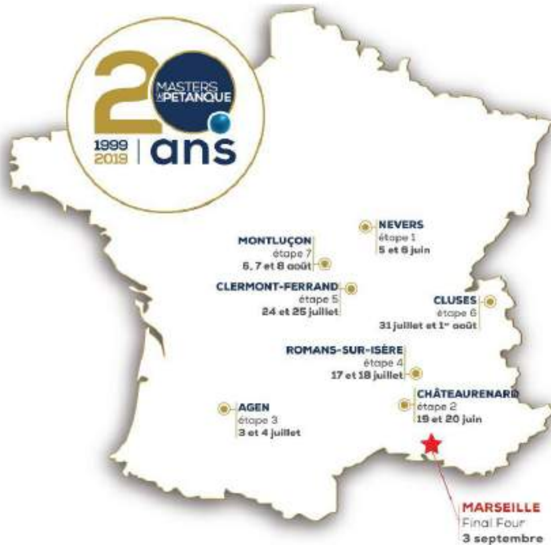
Masters de Pétanque 2019 - Quarterback