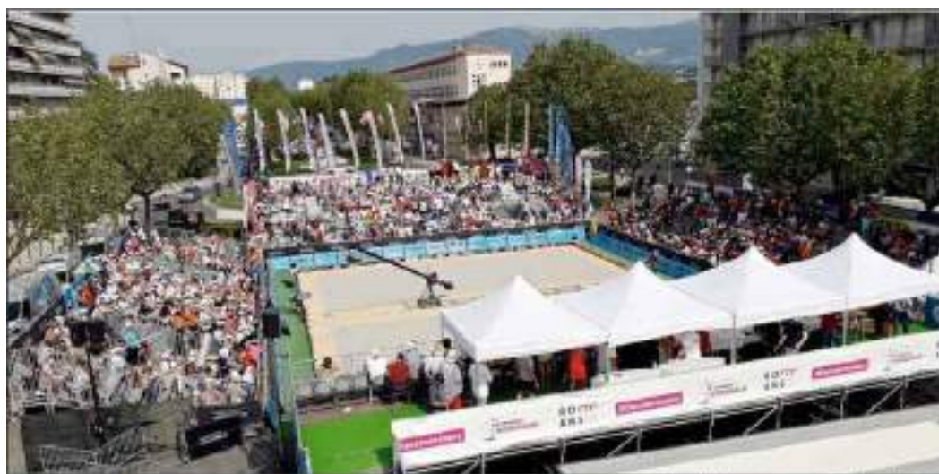
Un superbe plateau pour une compétition de très haut niveau.