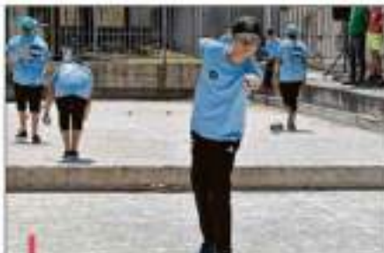
Les jeunes ont joué jusqu'à tard hier soir et ont montré toutes leurs capacités à bien viser le tir.

Cette compétition, jumelée aux Masters de Pétanque, a pour objectif de faire naître ou d'entretenir des passions chez les jeunes et d'attirer de nouveaux licenciés. Elle a aussi montré que pour tirer comme pour pointer, la veine n'attend pas le nombre des années.