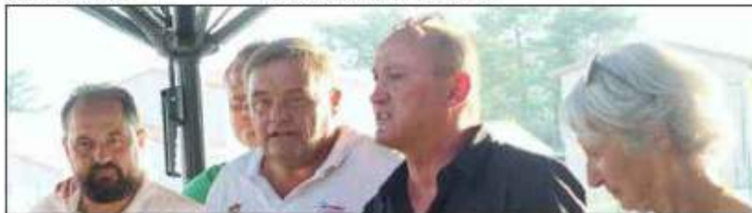
L'étape de Romans est devenue la référence des « Masters ».