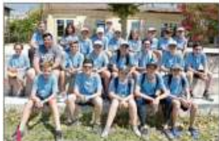
Les 3 équipes de jeunes Châteaurenardais qui ont gagné leur ticket pour concourir hier après-midi dans les Masters jeunes.