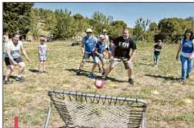
Sept ateliers étaient proposés aux enfants et à leurs parents et les équipes étaient mixtes pour toutes les rencontres.