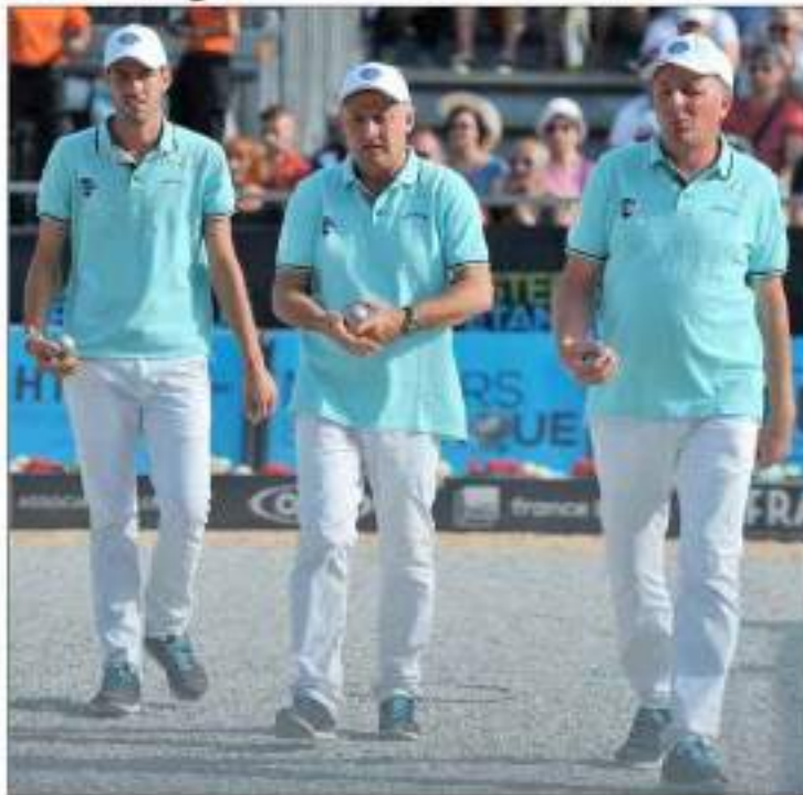
À Romans-sur-Isère la semaine dernière, le trio Rocher, Lucien et Suchaud a buté en demi-finale après avoir sorti en quart l'équipe d'Italie de Rizzì.

finale, vous restez deuxième et dans idéalement placé pour le Final Four.