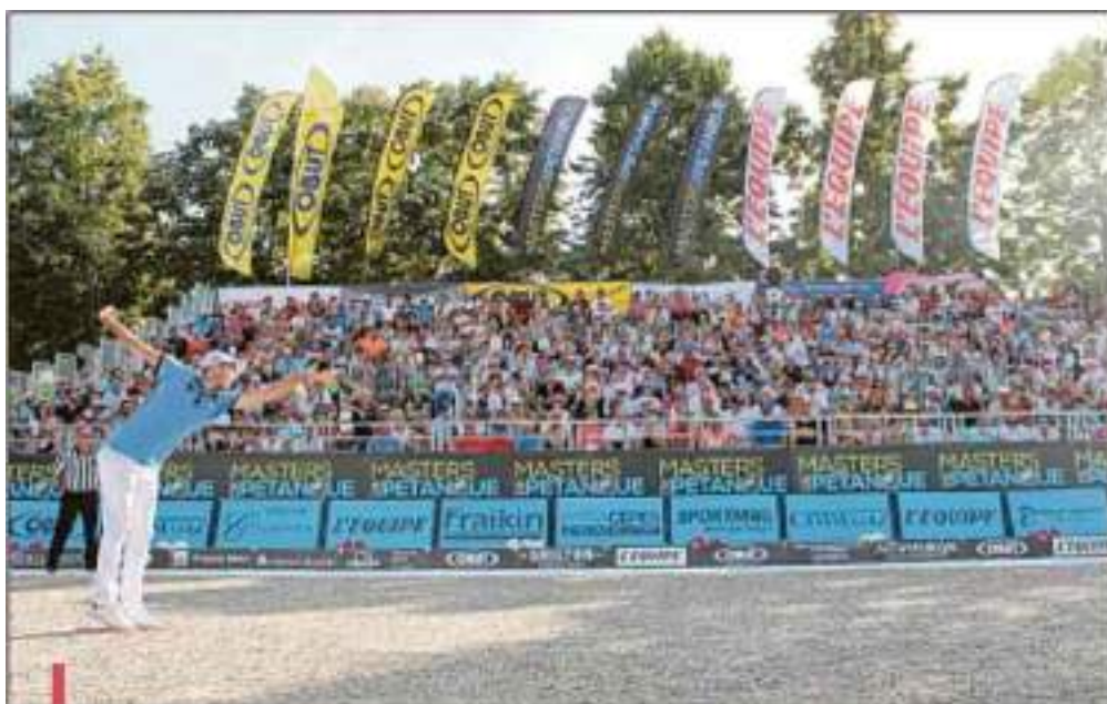
Le niveau du "final four", dont le partenaire principal est le Conseil Départemental des Bouches-du-Rhône, sera particulièrement relevé.