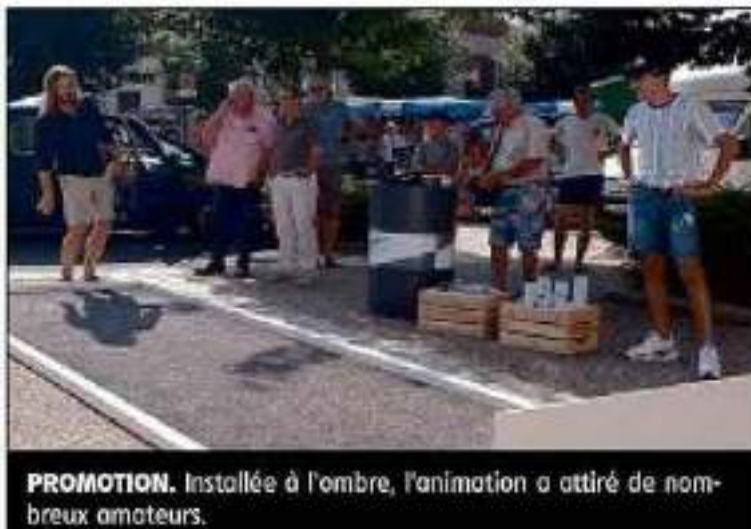
PROMOTION. Installée à l'ombre, l'animation a attiré de nombreux amateurs.

C'est ainsi que dernièrement, un terrain de pétanque éphémère s'est improvisé sur la place de la mairie. Et tous les pétanqueurs, qu'ils soient licenciés ou néophytes, ont pu pratiquer leur sport ou leur loisir favori. Et tous se sont vus remettre une série de petits cadeaux publicitaires. ■