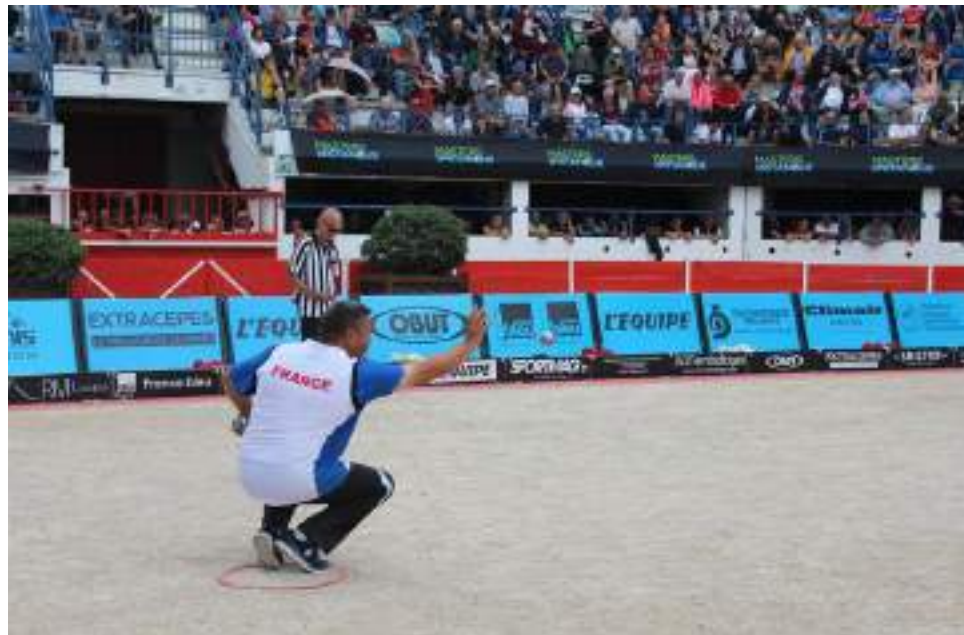
Masters de Pétanque à Châteaurenard 2018 - Quarterback - DR 20h : présentation des équipes et tirage au sort

Parties conviviales entre élus locaux, partenaires de l'événement et champions de pétanque - sur invitation