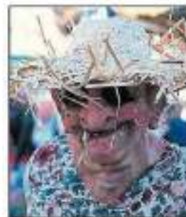
La pétanque a toujours ses inconditionnels adeptes.