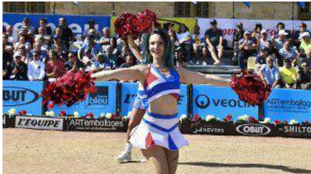
Entre les rencontres, l'ambiance était assurée.