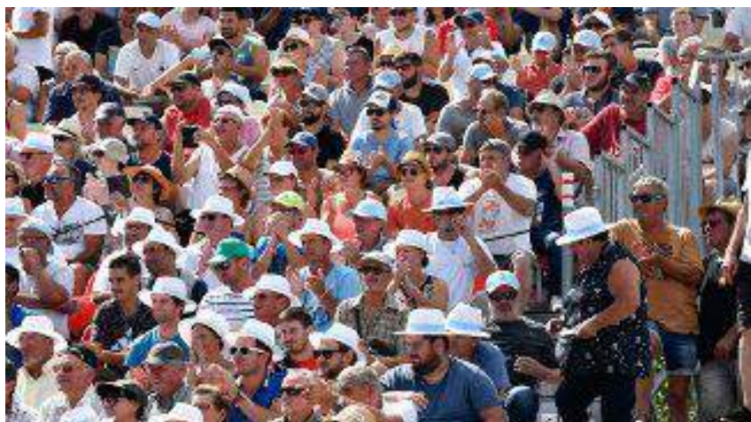
Masters de pétanque 2019 à Montluçon.