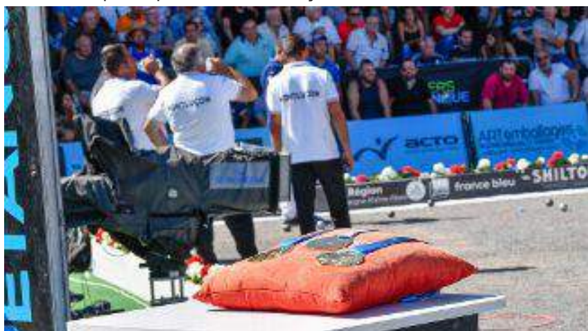
Masters de pétanque 2019 à Montluçon.