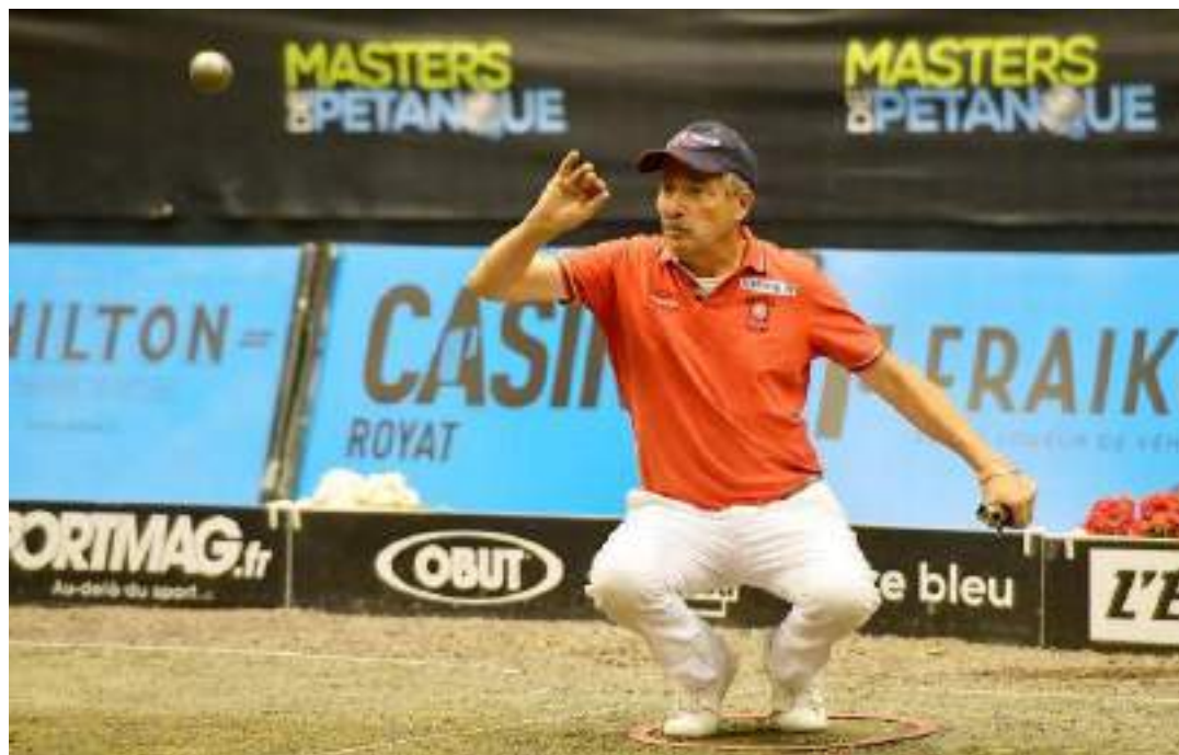
Illustration. © Richard BRUNEL

En 2019, Clermont-Ferrand, le Puy-en-Velay et Moulins compteront parmi les 40 compétitions qualificatives pour les Masters de pétanque 2020 .