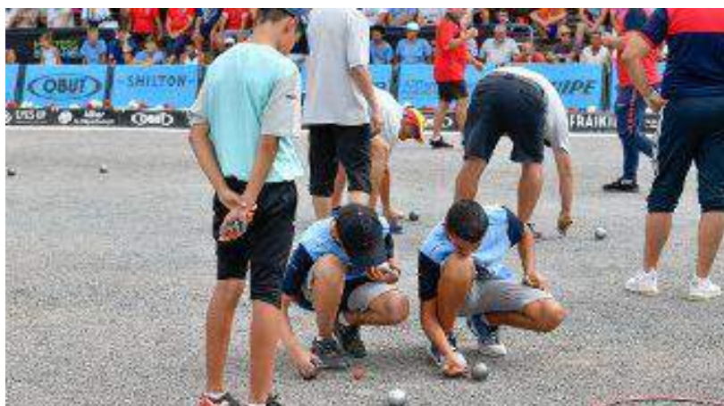
Masters de pétanque 2019 à Montluçon. Les jeunes.