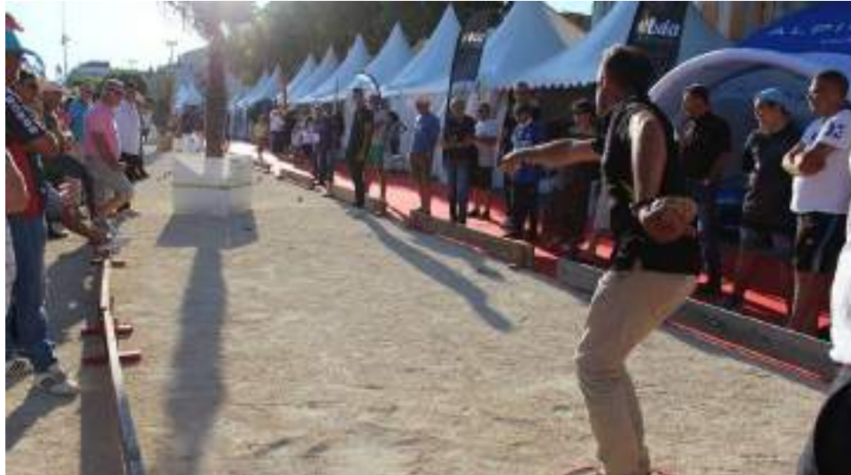
Masters de Pétanque - Quarterback - DR

La tournée des Masters de Pétanque fait étape à Montluçon les 6, 7 et 8 août. Retrouvez toutes les infos pratiques en-dessous