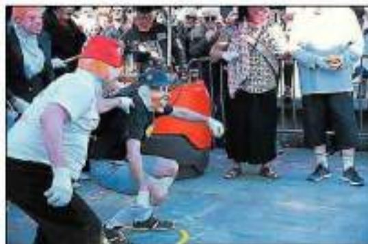
Le jeu de boules, un sport enseigné de main de maître par les Encantados.

Le deuxième événement sportif, et non des moindres, en terre locale a lui aussi fait le plein de regards et de commentaires des « Badaires ». Il s'agissait ni plus ni moins d'un master de pétanque pour les juniors. Et quand on parle de jeu de Boule chez les « Encantados », cela intègre moult accessoires tant musicaux que dégustatifs. Tir au but, plombée retenue, les aînés ont apporté en techniciens idoines de la question bouliste les conseils les plus avisés. Cependant, certaines déviances ont tout autant été appli-