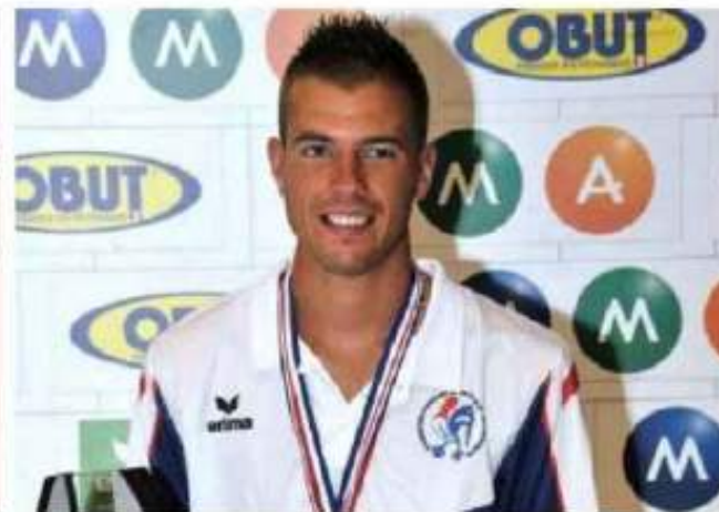
Le champion du monde Dylan Rocher sera présent pour rencontrer les amateurs de ce sport.