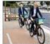
« Les vélos électriques sont loués depuis juin. »

Après avoir lancé son service de location de vélos à destination descriptif au Puy-en-Velay et à Craponne-sur-Arzon, la communauté d'agglomération ira offrir un passe-accès en faveur des mobilités douces avec la création d'un schéma directeur vélo. Il aura vocation à définir la politique en faveur de l'usage du vélo dans le territoire de l'Agglo et permettra éventuellement d'être relayé dans un appel à projet lancé par Adema (Agence de l'environnement et de la maîtrise de l'énergie). À la clé, la possibilité d'obtenir un financement de 200 000 euros qui pourrait être destiné à l'achat de vélos-cargos type triporteur pour des déplacements en famille ou le transport de marchandises.