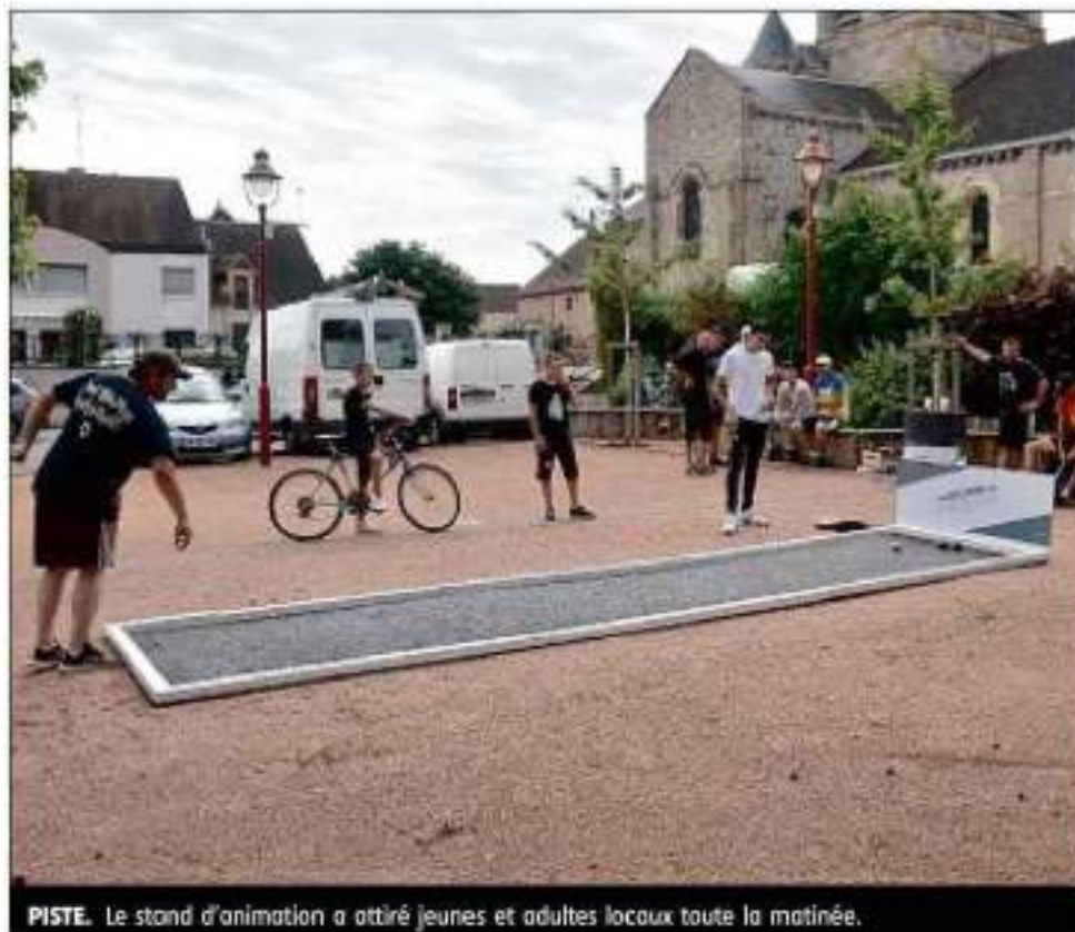
PISTE. Le stand d'animation a attiré jeunes et adultes locaux toute la matinée.