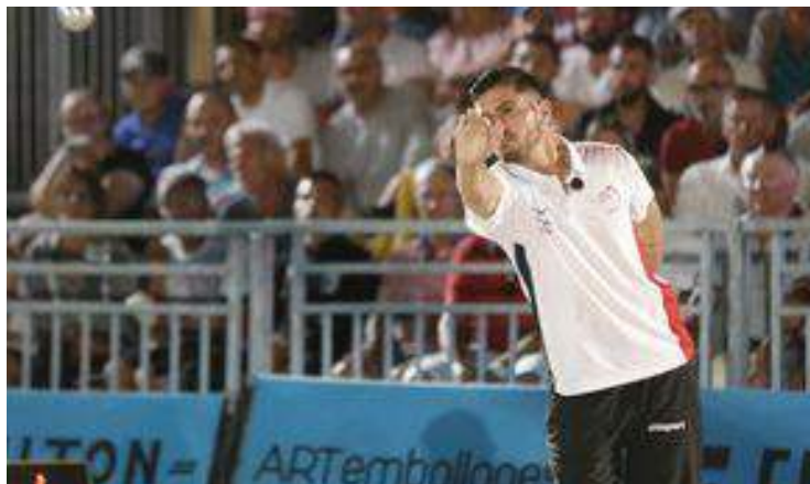
Finale des Masters de pétanque

Tout le monde est sous le charme, au plus grand bonheur des insulaires. "Ç a fait parler de l'île , salue Bruno, a vec les plans drones de la télé, ça fait des images magnifiques. Ça nous fait connaître et ça nous met en valeur ". Avant l'arrivée des camions et l'installation qui a duré quatre jours, le terrain est avant tout celui des habitants. " C'est le mien , signale Marc, Frioulais depuis 40 ans. Ce matin j'ai été voir Quintais et je lui ai dit 'Attention, il y a des pièges.' Il a dû m'écouter parce qu'ils ont gagné la demi-finale. "