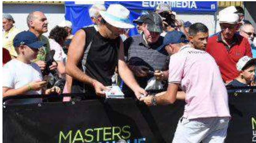
Masters de pétanque 2019 à Montluçon.