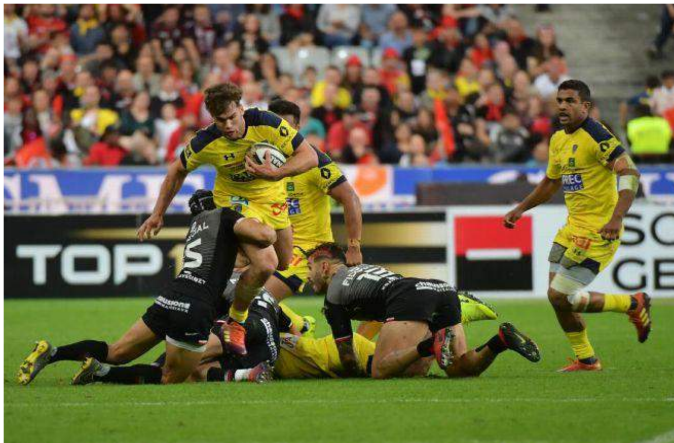
Les Clermontois reprennent les choses sérieuses ce vendredi contre La Rochelle en amical.

Voici le programme du mardi 6 août au dimanche 11 août des clubs auvergnats et des événements sportifs dans la région.