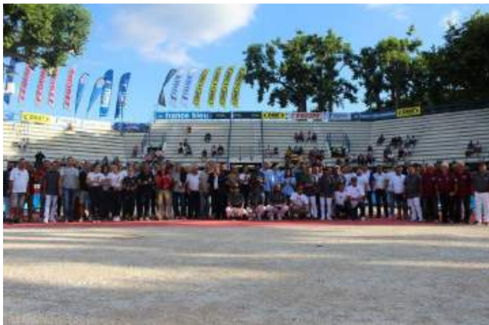
Masters de Pétanque Châteaurenard 2018 - Quarterback - DR