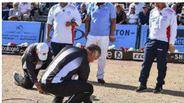
Les arbitres ont rarement eu l'occasion d'intervenir. Mais ont tout de même sévi en finale et distribué deux... avertissements.