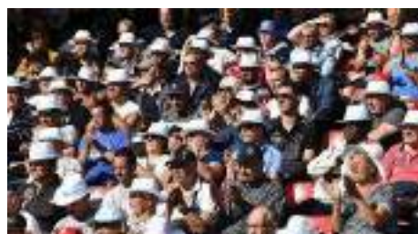
d'accueil revue à la hausse.