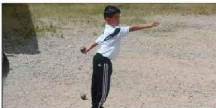
Une belle attitude pour ce jeune joueur d'Arvant.

À la suite de cette dernière étape, l'école de pétanque a organisé le repas des bénévoles et amis, avec 43 convives. Il s'est évidemment conclu par des parties de pétanque.