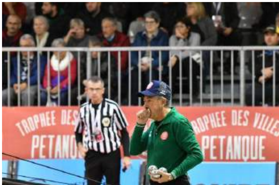
Christian Fazzino est une figure emblématique de la pétanque .

Christian Fazzino, élu joueur du siècle par ses semblables, est engagé aux Masters de pétanque 2019 , à Nevers .