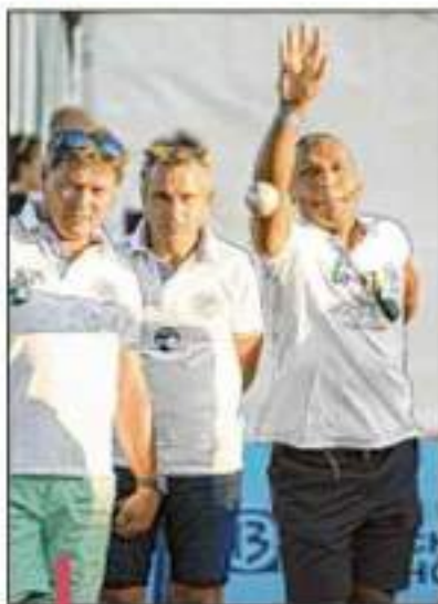
L'ancien entraîneur de l'OM, Franck Passi, était présent.