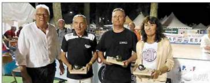
L'équipe Lagarde, meilleure aveyronnaise à l'International.

Montluçon, et tout récemment une demi-finale en tête à tête senior au Mondial des Volcans à Clermont-Ferrand.