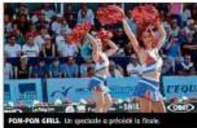
POM-POM GIRLS. Un spectacle a précédé la finale.