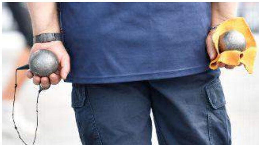
Masters de pétanque 2019 à Montluçon.