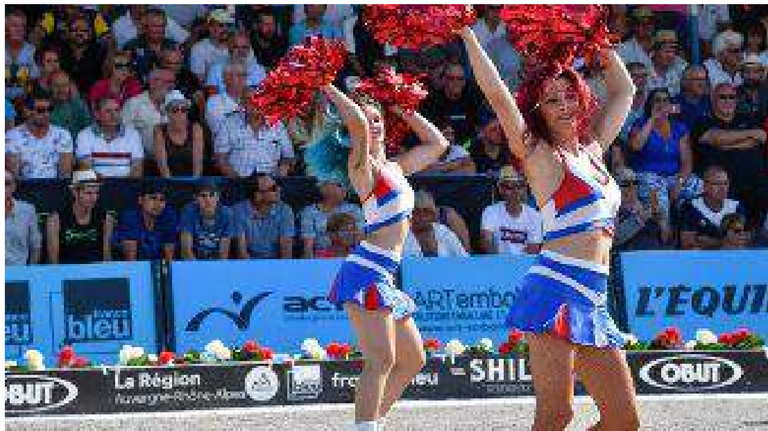
Masters de pétanque 2019 à Montluçon.