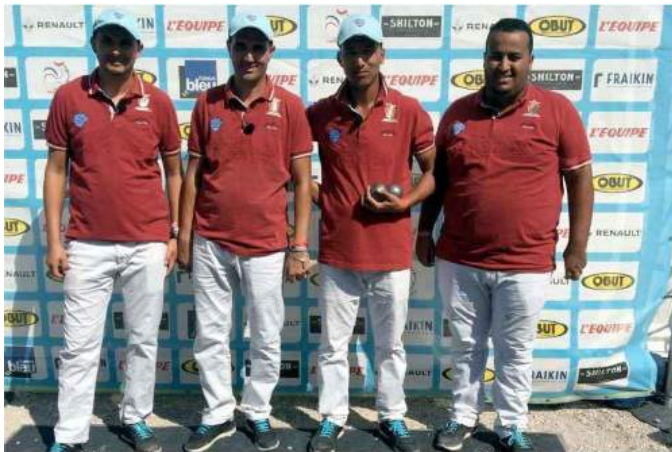
Tout au long de l'été, sur les Masters, l'équipe du Maroc a fait honneur à son statut de vice-championne du monde. FABRICE