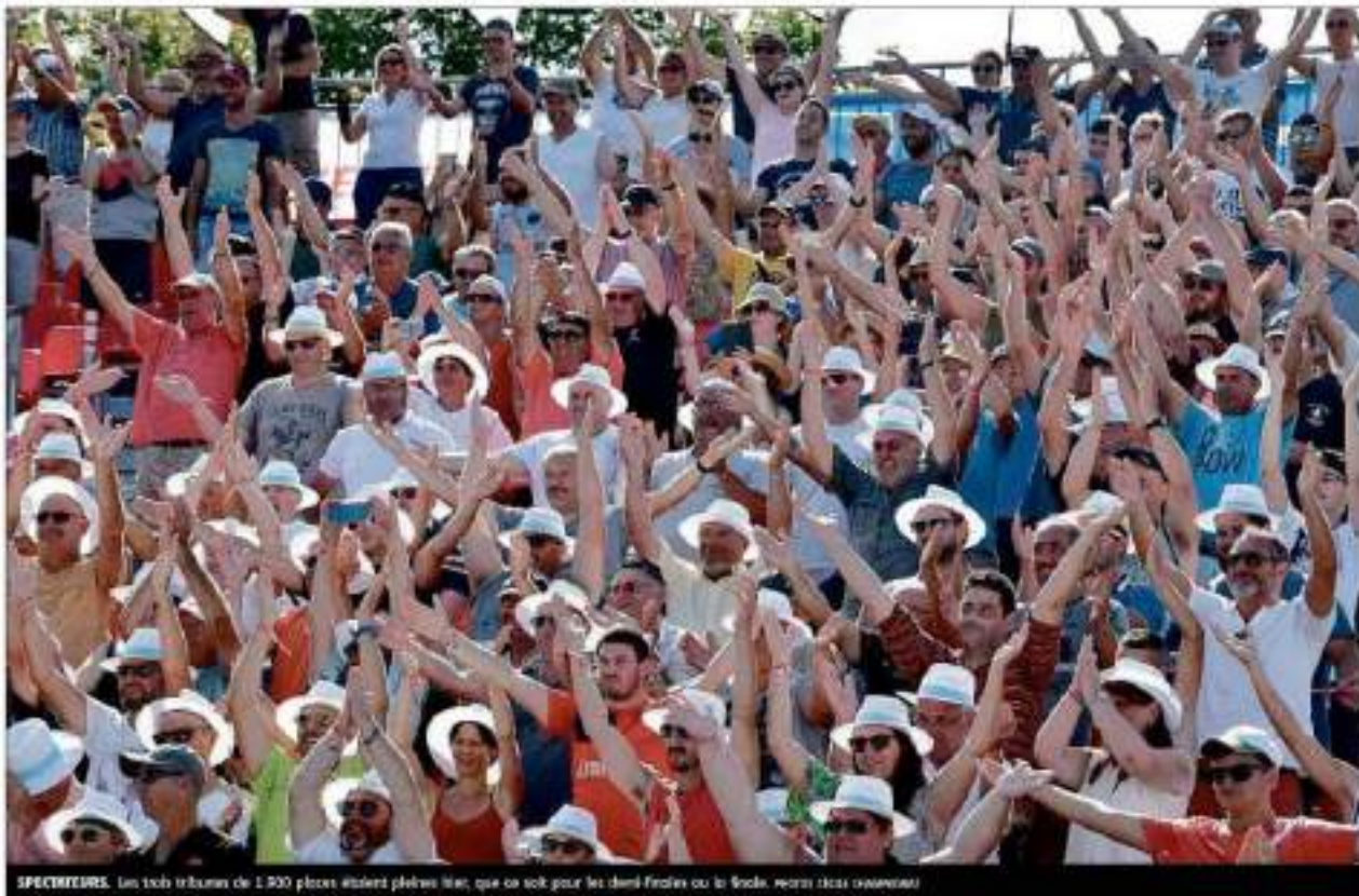
SPECTATEURS. Les trois tribunes de 1 500 places étaient pleines hier, que ce soit pour les demi-finales ou la finale.