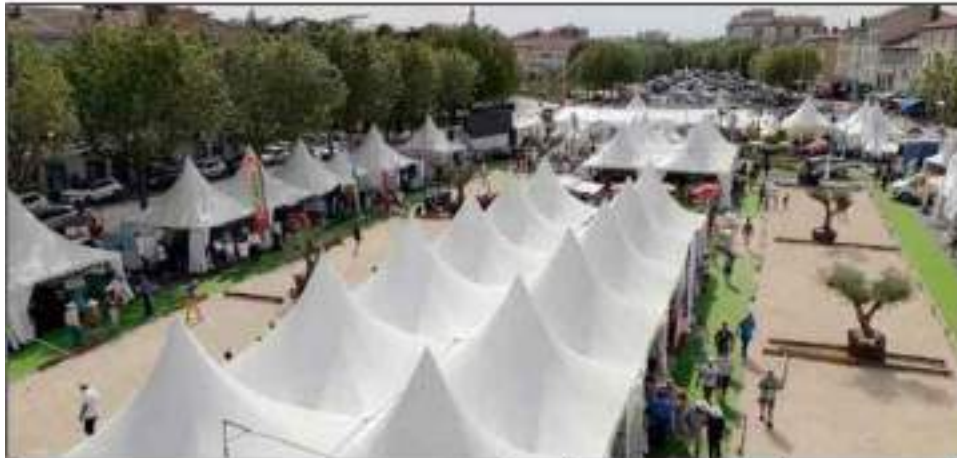
Un village des partenaires particulièrement convivial.