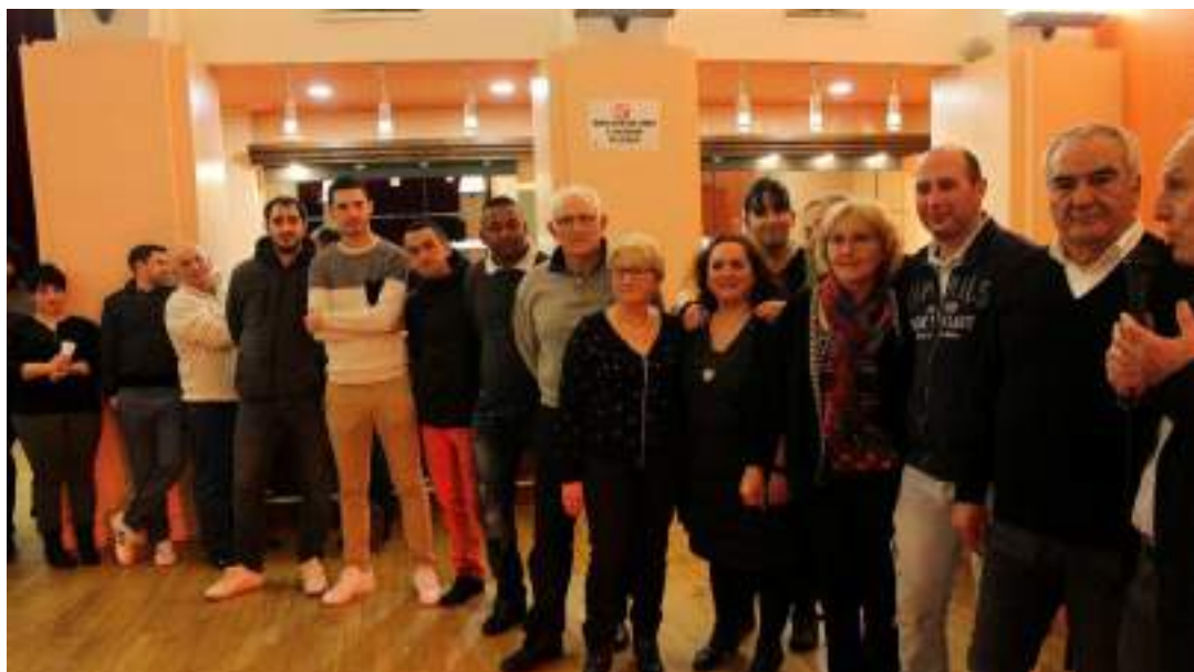
Ax honore ses champions de pétanque.

A-t-on déjà vu une ville comme Ax-les-Thermes, une petite ville pyrénéenne de 1 250 âmes, accéder au sommet national ? Et pourtant, c'est ce qu'on fait les pétanqueurs Axéens. En effet, la Pétanque locale a connu une saison 2018 extraordinaire.