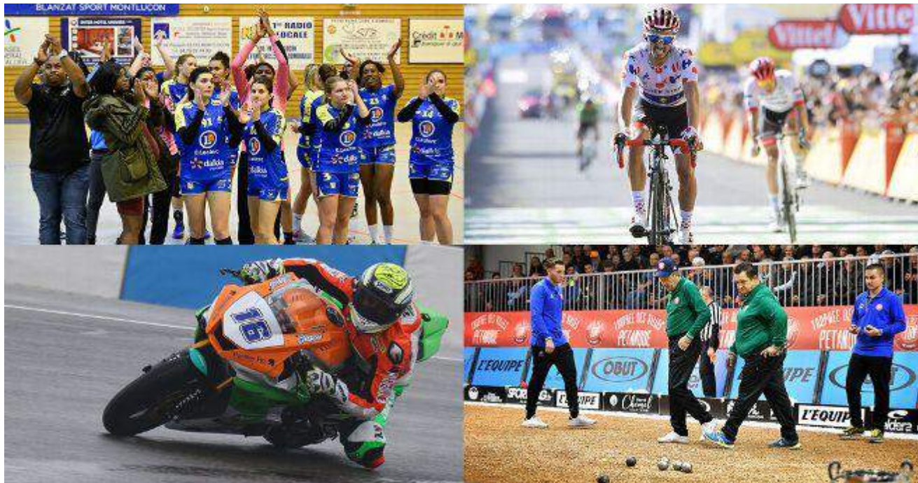
Les handballeuses du BSM, Julian Alaphilippe, Jules Cluzel et la pétanque

À défaut de promettre de se (re)mettre au sport en 2019, pourquoi ne pas plutôt jurer d'assister à toutes les compétitions prévues sur Montluçon et ses alentours en cette nouvelle année ?