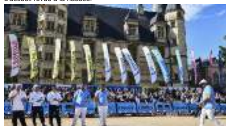
somptueux pour accueillir les Masters.