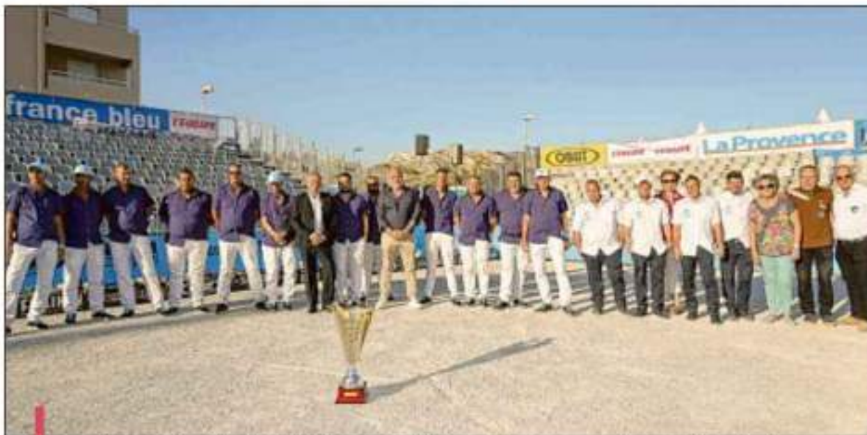
Avant d'en découdre aujourd'hui, les joueurs qualifiés ont prêté main-forte aux invités de la soirée d'ouverture.