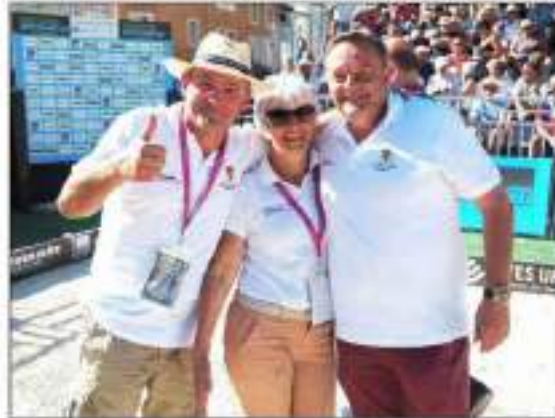
Une équipe parfaite.