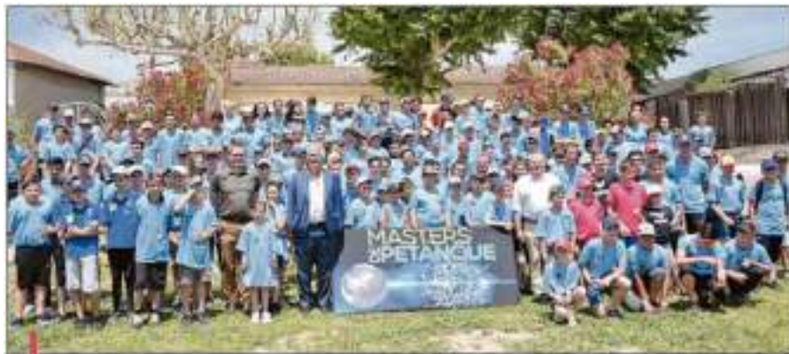
Seize-ou deux équipes ont participé hier aux Masters Jeunes de Pétanque, à la veille du grand rendez-vous d'aujourd'hui.

Le très sympathique parrain des Masters Jeunes pour cette édition, a lui-même été intégré au plateau des Masters de Pétanque à l'âge de 15 ans. "J'ai eu la chance de côtoyer les plus grands champions et d'apprendre des meilleurs dès le début de ma carrière. Il est donc important pour moi d'être présent auprès des jeunes talents pour les accompagner et les conseiller dans la pratique de notre sport", affirme-t-il.