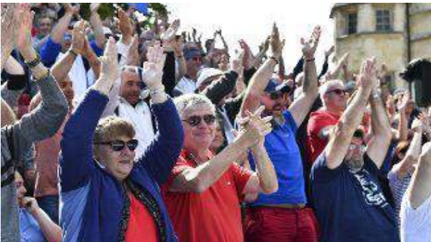
Le clapping made in pétanque a lancé la finale.