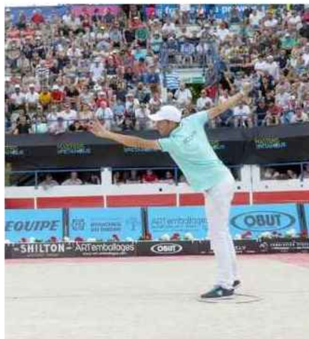
Dylan Rocher, 5 fois champion du monde, est le parrain du masters jeunes.