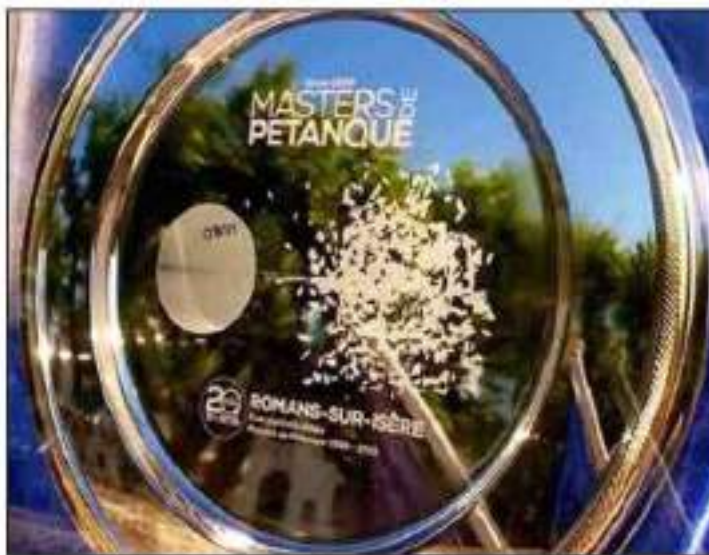
Romans a été désignée « la plus belle étape des vingt années d'existence » des Masters .