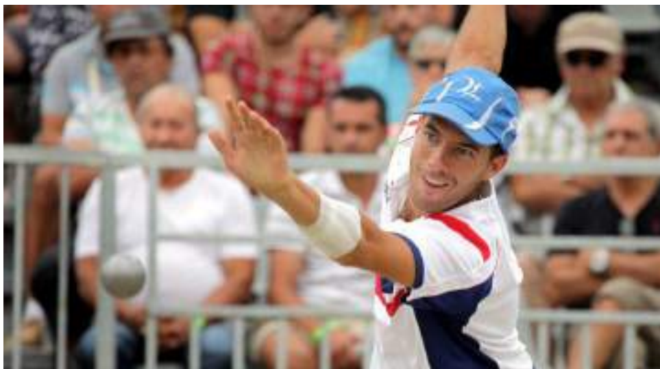
La star de la pétanque Dylan Rocher fera une démonstration sur le Gravier mercredi, avant le concours jeudi.