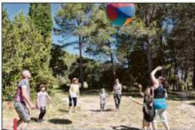
Le kin-ball, un sport collectif qui vient du Québec et où l'on joue avec une balle d'1,22 m de diamètre. (PHOTOS N.C.-B.)

Et c'est ainsi que parents et enfants des écoles Péri, de Cabarnes, des Paluds-de-Noves et de Verquières ont participé à