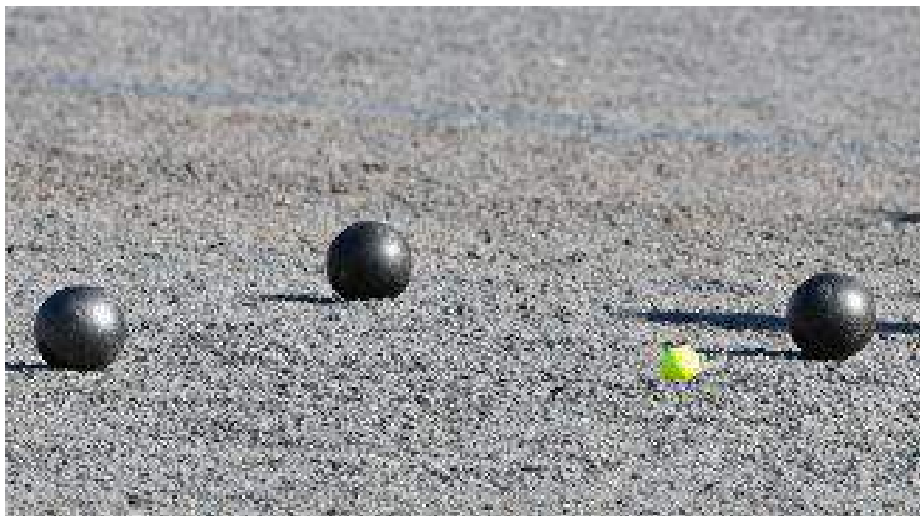
Masters de pétanque 2019 à Montluçon.