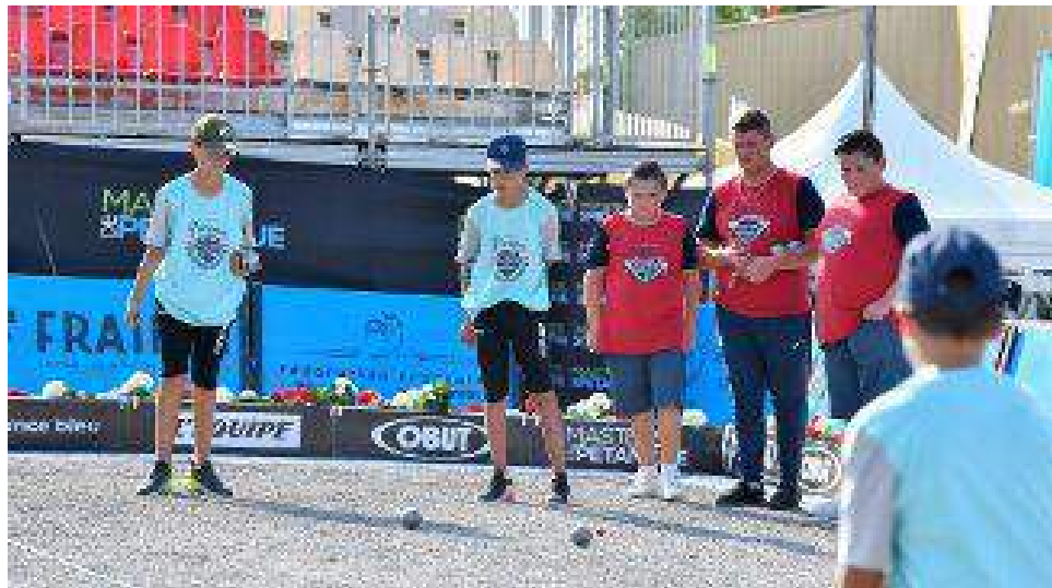
Masters de pétanque 2019 à Montluçon. Les jeunes.