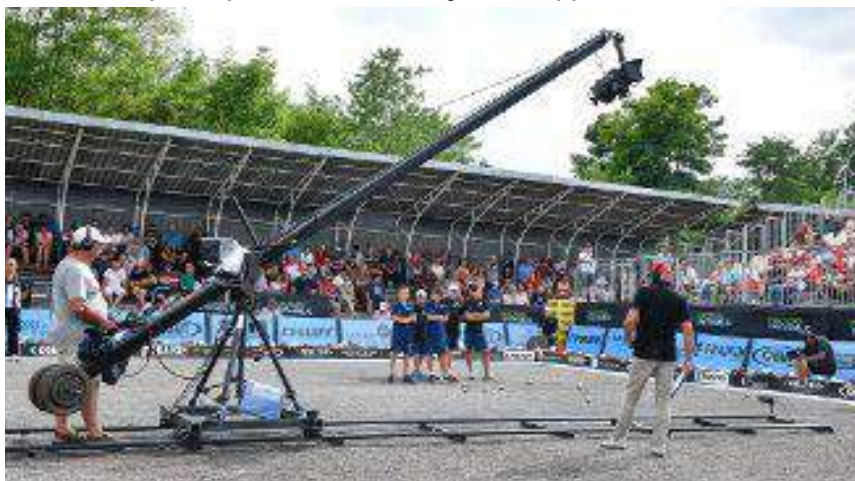
Masters de pétanque 2019 à Montluçon.