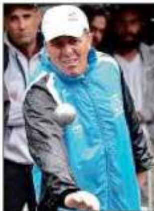
SUCHAUD. Vainqueur sans jouer, hier.

En revanche pour Christian Fazzino, tout se jouera à la maison, jeudi prochain à Montluçon, dans le boulodrome qui porte son nom, lors de la septième et ultime étape. Actuellement sixième au classement (19 pts), il compte cinq longueurs de retard sur la quatrième et dernière place qualificative, occupée par l'Italie (24