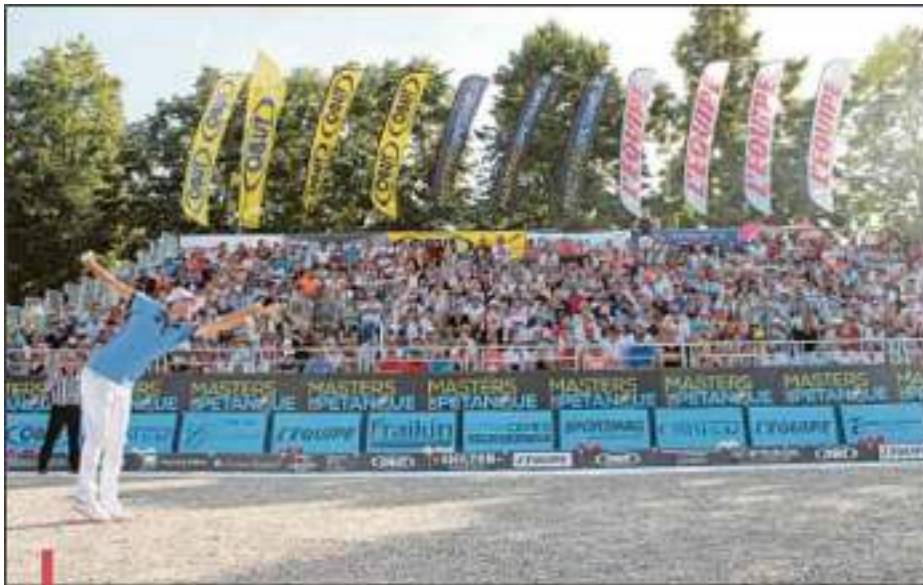
Le niveau du "final four", dont l'organisation sera soutenue par le Conseil Départemental des Bouches-du-Rhône et la Ville de Marseille, sera particulièrement relevé.