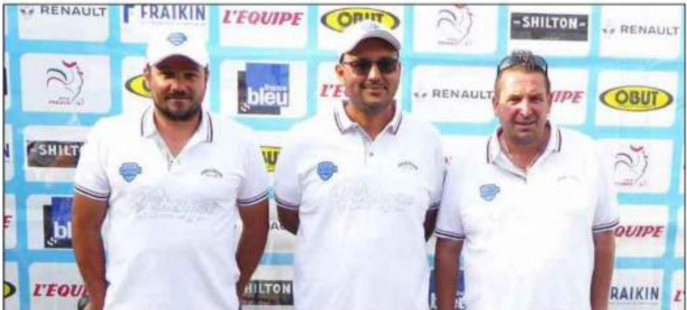
La quadrette ranaise a crânement défendu l'honneur des couleurs locales.