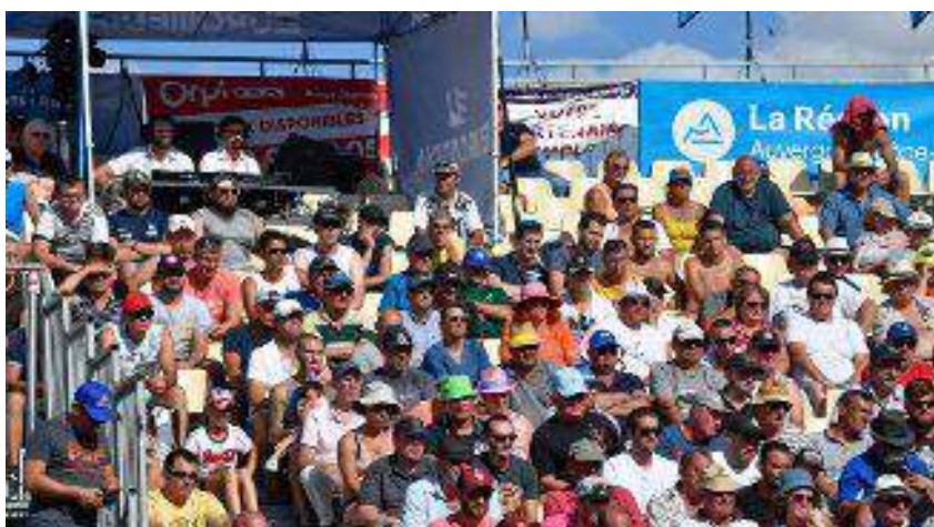
Masters de pétanque 2019 à Montluçon.