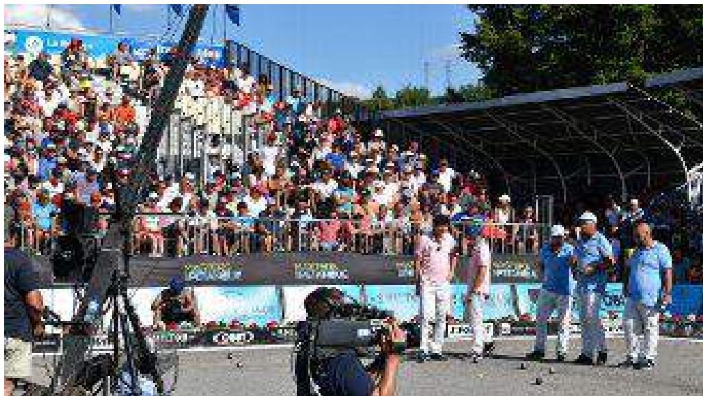
Masters de pétanque 2019 à Montluçon.