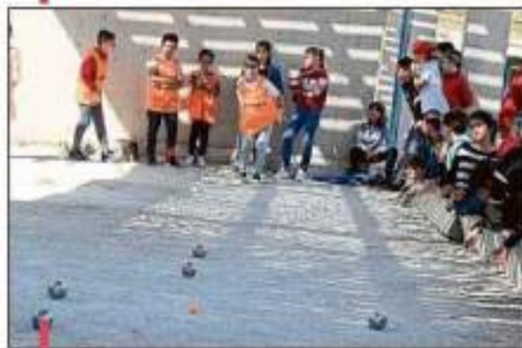
Mardi après-midi, on a pointé et on a tiré pour décrocher le ticket qui permettra de participer aux Masters jeunes en juin.