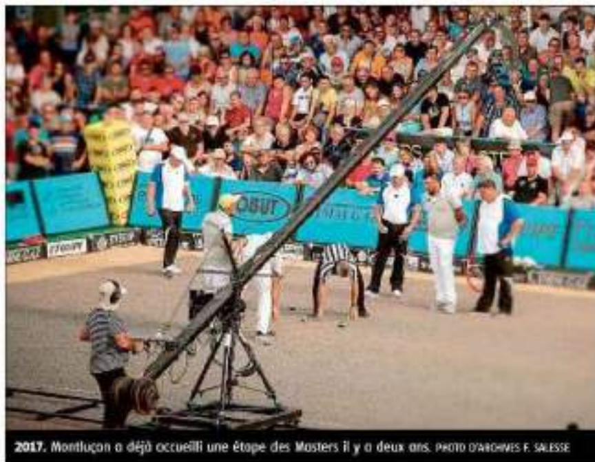
2017. Montluçon a déjà accueilli une étape des Masters il y a deux ans.

diées aux Masters jeunes, aujourd'hui puis demain, c'est à compter de 9 heures, jeudi, qu'auront lieu les premiers jetés de hut. Avec des mains plus ou moins tremblantes. En effet, deux formations ont d'ores et déjà composé leur billet pour les Bouches-du-Rhône, les équipes de France (1 er au clas-