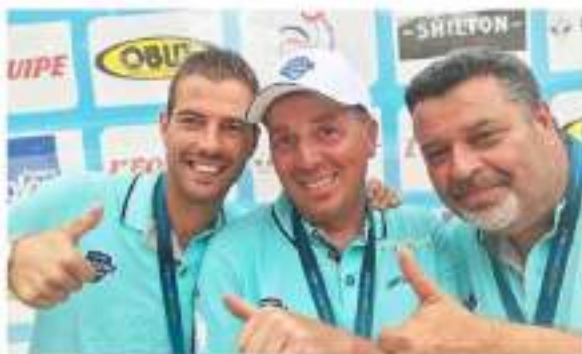
Coucou, les voilà ! Dylan Rocher, Philippe Suchaud et Philippe Quintais font emporter à Châteaurenard, deux semaines après leur élimination précoce à Nevers.