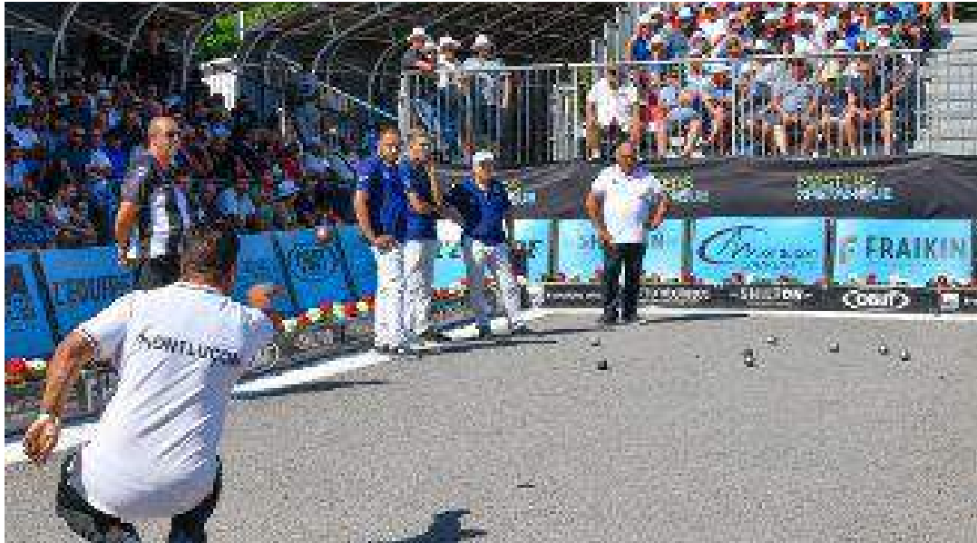
Masters de pétanque 2019 à Montluçon. L'équipe locale de Désertines.