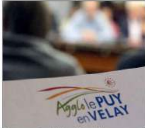
« La communauté d'agglomération du Puy-en-Velay, ce sont 73 communes et près de 85 000 habitants, représentée par 99 élus. »

Maire depuis 2008, elle a intégré l'Agglo au 1 er janvier 2017. « À Lisac, un ordre du jour chargé comprend dix délibérations au maximum, et il faut environ trois heures à nos conseillers pour décider, en toute conscience et en toute connaissance, des choix qui leur sont demandés. Je ne vois pas comment je pourrais, même en une nuit, décider avec intelligence sur 91 points différents (des délibérations ont été ajoutées en