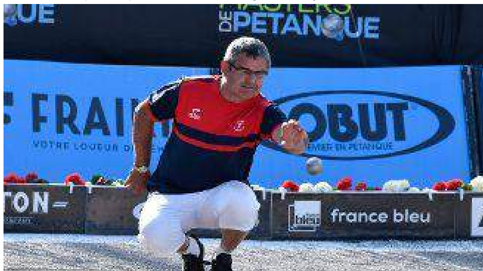
Masters de pétanque 2019 à Montluçon.