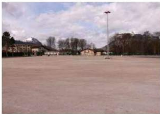
Le parvis des Esserts à Cluses sera aménagé pour accueillir cette compétition.