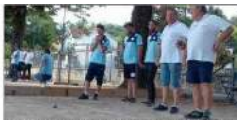
L'équipe du CP Neuville (en bleu) a été éliminée par Mantoro (Fréjus).

chaud (Pay de Dôme), multiples champions du monde. Christian Fazzino (Lyon) qui avait été élu joueur du siècle était là. De même que Tyson Molinas (Lyon) et Christian Bézembly (Aix les Thermes). Coup de tonnerre : l'élimination de la formation Quintais face à Lebas (Bron). Les autres équipes ont toutes tiré leur épingle de