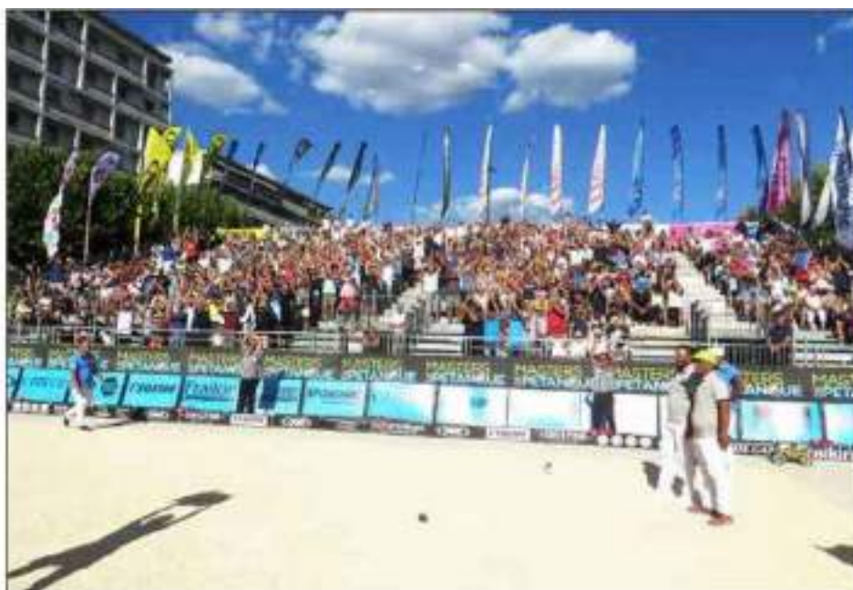
Un succès populaire assuré.

Notre capacité à organiser de tels événements attire des joueurs de haut niveau et aussi les jeunes.