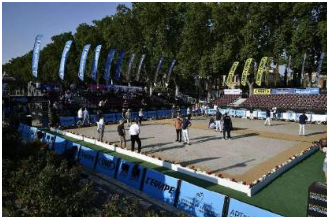
Huit équipes, dont une locale sélectionnée hier mercredi, de trois s'affronteront pour décrocher le titre de l'étape agenaïse. Breton Thierry